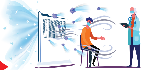
ウイルスガードウォール 患者 医者